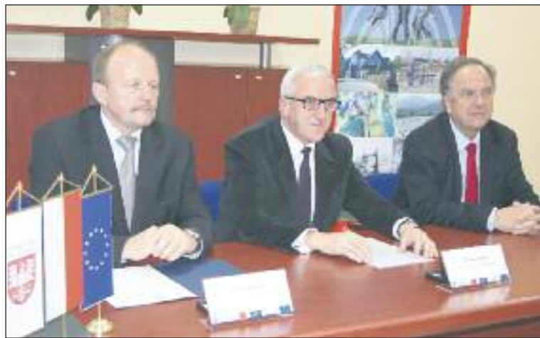
Podpisanie umowy na realizację zadania.

33-letnia kobieta kierująca Audi zginęła po tym, jak zjechała na przeciwny pas i uderzyła w ogrodzenie z podmurówką. Na razie nieznane są przyczyny wypadku. Kobieta zginęła na miejscu w wyniku odniesionych w wypadku obrażeń. j