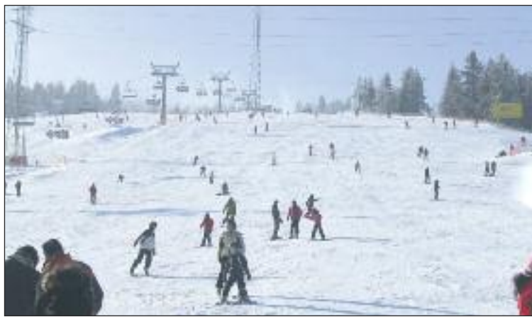
Narciarze z utęsknieniem czekają na skipasy.

Kolejne wyciągi na Podhalu decydują się połączyć swoje siły w walce o narciarzy ze słowacką konkurencją. Jednym z najlepszych sposobów są tzw. skipasy czyli możliwość korzystania z kilku wyciągów narciarskich postępując się jednym karnetem.