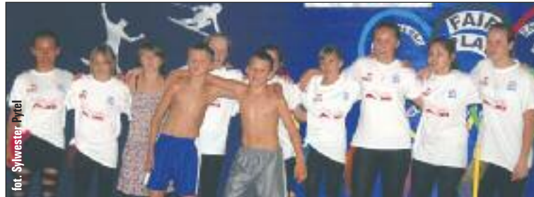
Finał widowiska na otwarciu sali.

Dzień Edukacji Narodowej zwany popularnie też Dniem Nauczyciela stał się w tym roku okazją, aby uroczystie otworzyć i przekazać dzieciom z Czarnej Góry nową salę gimnastyczną w budynku Szkoły Podstawowej nr 2. Sala powstała w starym budynku szkoły pamiętającym jeszcze czasy austriackie, aby teraz, po remoncie i przebudowie służyć w poprawie kondycji fizycznej młodego pokolenia.