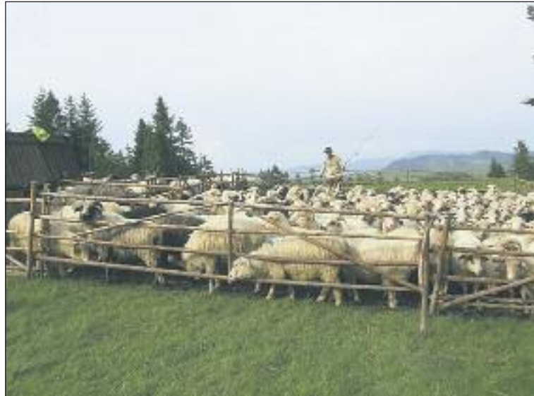
Bacowie liczą straty spowodowane przez wilcze watahy.

Wilki nie były już dawno agresywne i głodne jak w tym roku. Szacuje się, że podczas minionego sezonu wypasowego zagryzły co najmniej 300 sztuk owiec. Bacowie i hodowcy owiec załamują ręce.