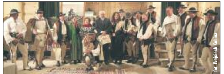
„Rodzinna” fotografia z zeszłorocznych Spotkań.

Na „Dziadońcynie Granie” przyjeżdżają do Bukowiny Tatrzańskiej najlepsi muzykanci oraz miłośnicy kultury ludowej. Spotkania nie mają charakteru konkursu, jednak powołana Komisja Artystyczna, złożona ze znanych muzykantów i fachowców od muzyki podhalańskiej przyznaje nagrodę honorową „Dziadońcyn smyczek”. Początek muzykowania w „Domu Ludowym” o godz. 13.00. Pięknie pytomy.