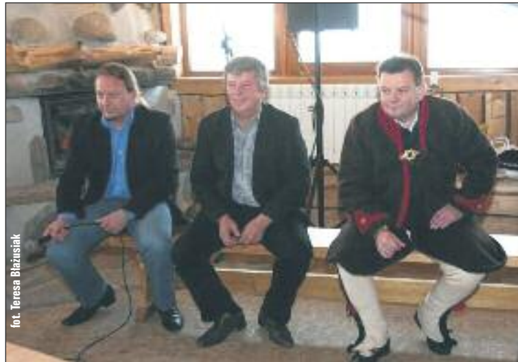
Trzech wójtów na „egzaminie”

23 października 2011 r. w Ośrodku Rekolekcyjnym Księża Marianów na Grocholowym Potoku w Rzepiskach Szkoła Podstawowa nr 2 im. Jana Pawła II, Księża Marianie oraz mieszkańcy Rzepisk zorganizowali IX Dzień Papieski pod hasłem: „Jan Paweł II – Człowiek Modlitwy”. To był pierwszy Dzień Papieski po ogłoszeniu Jana Pawła II błogosławionym.