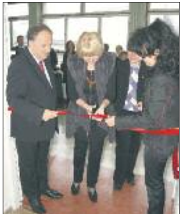
Prace nad utworzeniem ZCW rozpoczęły się blisko 3 lata temu. Ma to być miejsce, gdzie będą się

20 października uroczysto rozpoczęło swoją działalność Zakopiańskie Centrum Wolontariatu. To wspólna inicjatywa Urzędu Miasta Zakopane i Małopolskiego Hospicjum dla Dzieci, którego filia również wystartowała pod Tatrami. ZCW mieści się w Zakopiańskim Centrum Edukacji.